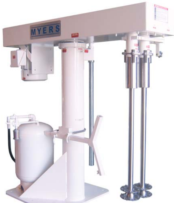
25 HP 850 – Inversor de frecuencia con eje esparcidor manual.